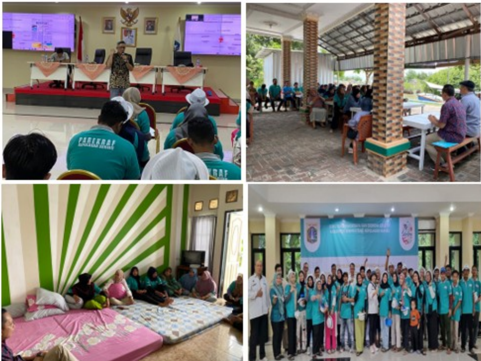
Gambar 1. Kegiatan PKM

listrik dan pasokan air. Selain teori, peserta juga mengikuti sesi praktek yang meliputi pengelolaan pesanan kamar, penyajian makanan dan minuman, serta administrasi pembayaran saat tamu meninggalkan ruangan. Aktivitas ini dirancang untuk memberikan pemahaman menyeluruh dan keterampilan praktis yang diperlukan dalam manajemen